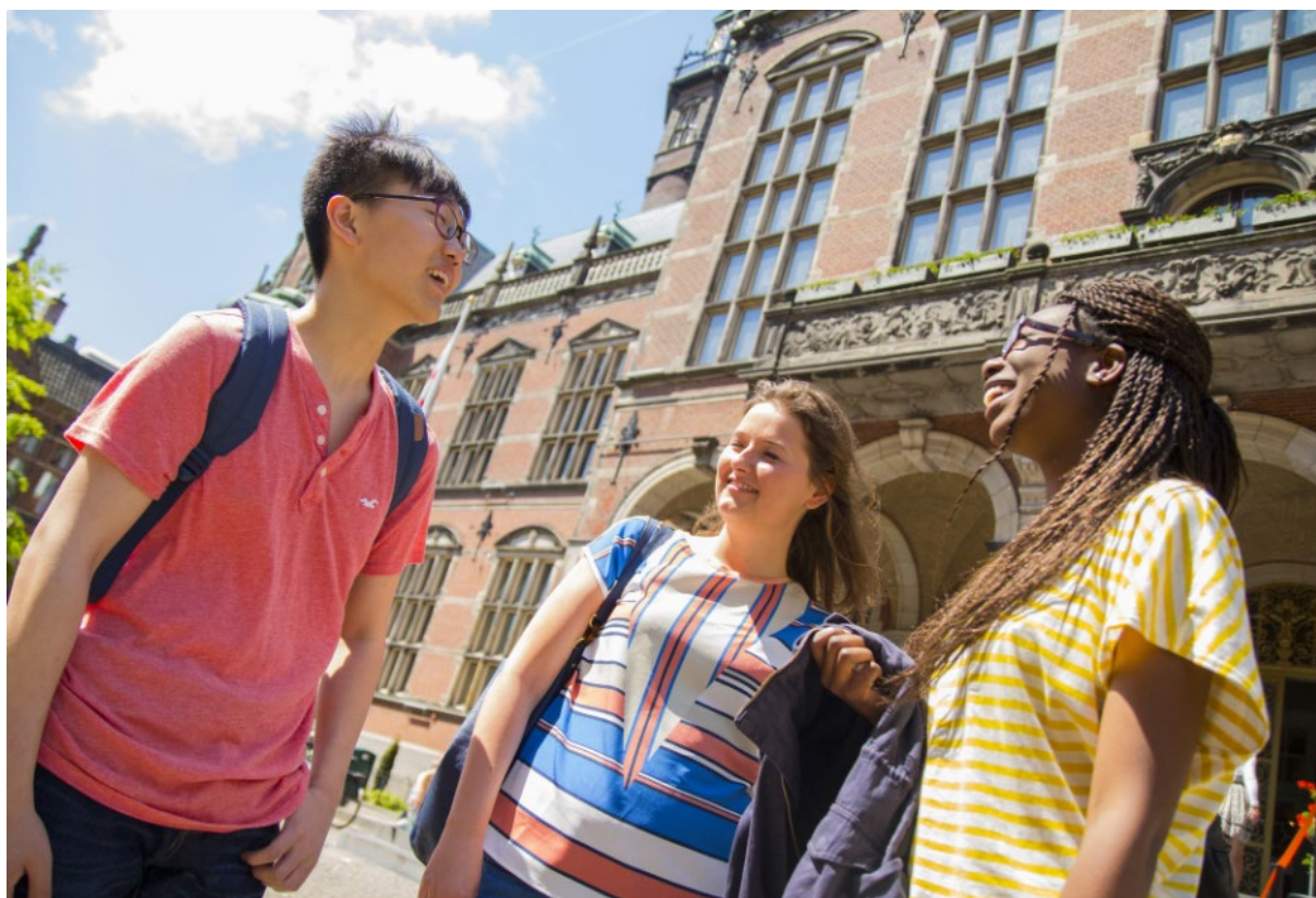
Studenten voor het academiegebouw zomer 2022