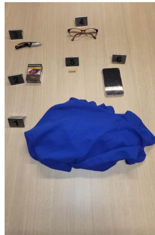
Figuur 2 Bewijsfoto bij vignet

Hierdoor heb ik noodgedwongen moeten stoppen met mijn vrijwilligerswerk bij de voedselbank, terwijl ik daar vroeger zoveel plezier uit haalde.” Het slachtoffer wendde zich tot de verdachte met tranen in haar ogen, “Waarom heb je mij dit aangedaan?”. “Vaak mis ik de oude ik, die een stuk zelfverzekerder,