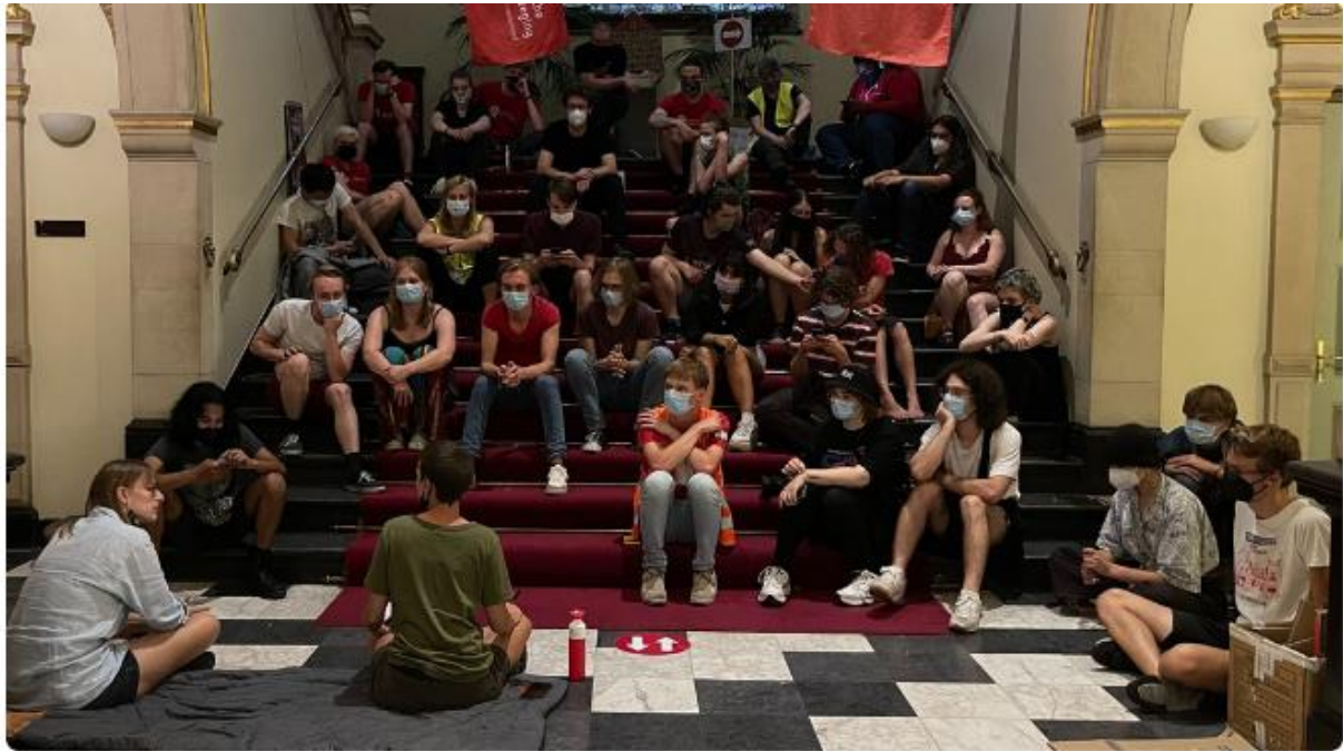
Studenten tijdens de bezetting van het academiegebouw in 2021