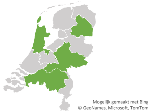
Figuur 2: Afbakening provincies (groen = geselecteerde provincie)

De overgebleven provincies worden op basis van een geografisch kenmerk uitgekozen. Hierbij wordt een provincie gekozen die in een regio ligt die, na toepassing van de eerdere criteria, nog wordt ondervertegenwoordigd in de analyse. Op basis van de ligging is ervoor gekozen om Noord-Holland mee te nemen in de analyse, omdat het Noordwesten nog onderbelicht is in de analyse. In Figuur 2 worden de geselecteerde provincies visueel weergegeven.