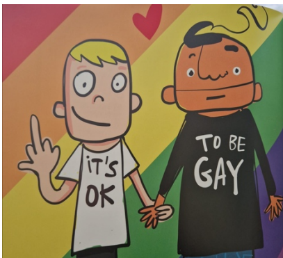
Figuur 5. Een Mannelijk Homoseksueel Stel

Noot. Aangepast overgenomen uit Sex safe (p. 122) , door H. Lourens, 2019, MYkillerbodymotivation B.V.