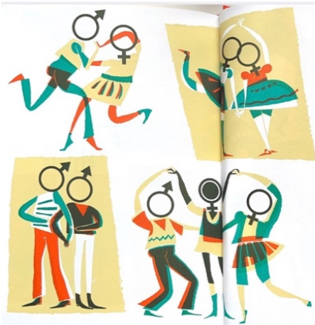
Figuur 4. Verskillende Seksuele Geaardheden

Noot. Aangepast overgenomen uit Seks is niks gek (p. /) , door B. Westera, 2021, Samsara