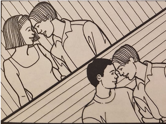
Figuur 2. Illustratie van Biseksualiteit

Noot. Aangepast overgenomen uit Ik weet nu waarom! (p. 156), door B. Minne, 1996, Deltas